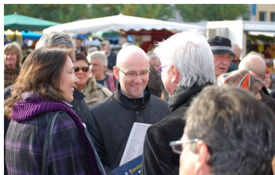
Dr. Peter Tauber im Gespräch auf dem Hanauer Marktplatz.

Dr. Peter Tauber und sein Team haben „Danke“ für das hervorragende Wahlergebnis gesagt. In Hanau verteilte das Team Tauber Postkarten, die mit einer kleinen Schokolade beklebt waren. „Ich bin nicht nur vor der Wahl, sondern auch danach immer ansprechbar und direkt bei den Menschen,“ erklärt Peter Tauber den Hintergrund der Aktion.