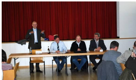
Dr. Peter Tauber bei der CDU Gründau in Gettenbach.

Dr. Peter Tauber war bei der CDU Gründau und bedankte sich dort für den Einsatz des Verbandes im Wahlkampf bedankt. Nun gelte es, zu prüfen, was die Entscheidungen in Berlin für den Main-Kinzig-Kreis konkret bedeuten. „Ich arbeite gerade den Koalitionsvertrag ab, um eben das genau zu prüfen. Dabei möchte ich gerne für die Städte und Gemeinden in den nächsten Jahren ein Ansprechpartner in Berlin sein“, so Tauber.